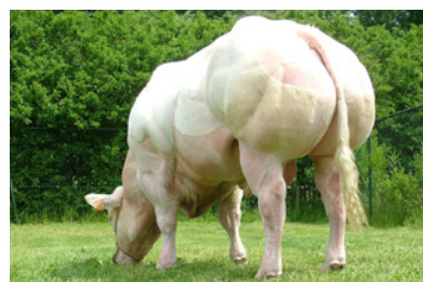
Oiseau de la Coue